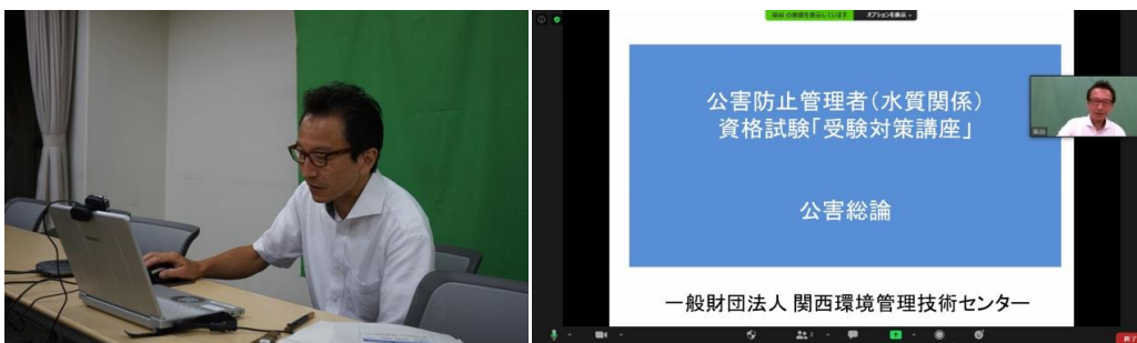
柴谷講師 講座風景